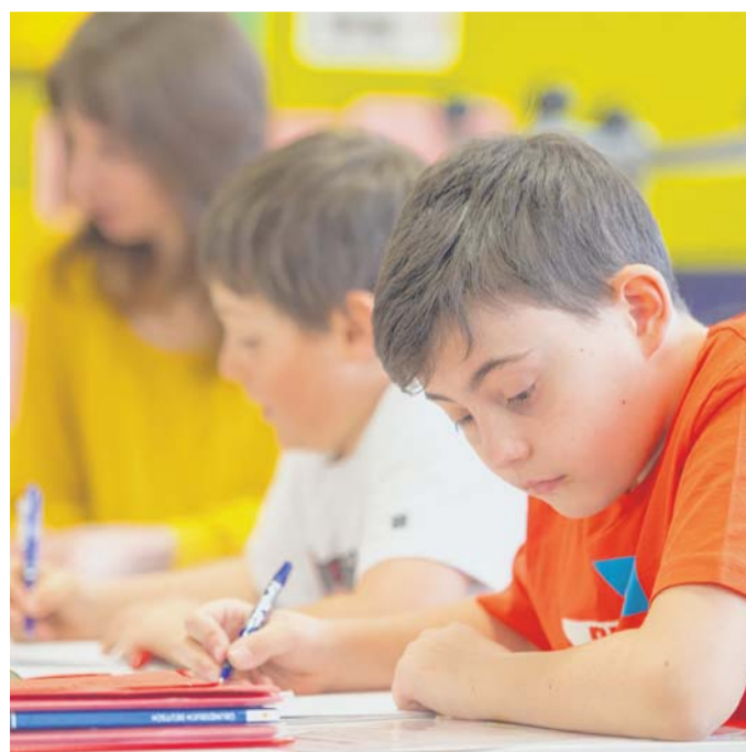
Schülerinnen und Schüler an der UNESCO-Mittelschule Bürs: zur Eigenständigkeit erzogen.

Es ist diese Selbstständigkeit, die an der UNESCO-Mittelschule Bürs von den Schülerinnen und Schülern verlangt und bewusst gefördert wird. Ergänzend zum klassischen Frontalunterricht müssen die Kinder in der Freiarbeit selbst Stoffeinheiten erarbeiten. Je nach Leistungsvermögen erledigen sie dann „nur“ die Basismodule oder schwerere Aufgabenstellungen. Unterstützt werden sie von zwei Lehrpersonen, die während der Freiarbeit ständig zugegen und den Kindern behilflich sind, wenn es Probleme gibt.