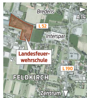
VN-GRAFIK, LUFTBILD: ORTHOPHOTOS © 2012 LAND VLBG.

men vom Architekturbüro Achammer aus Nenzing.